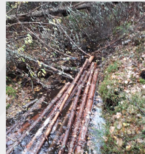
Puuta ojaan => lumo ja vesiensuojelu